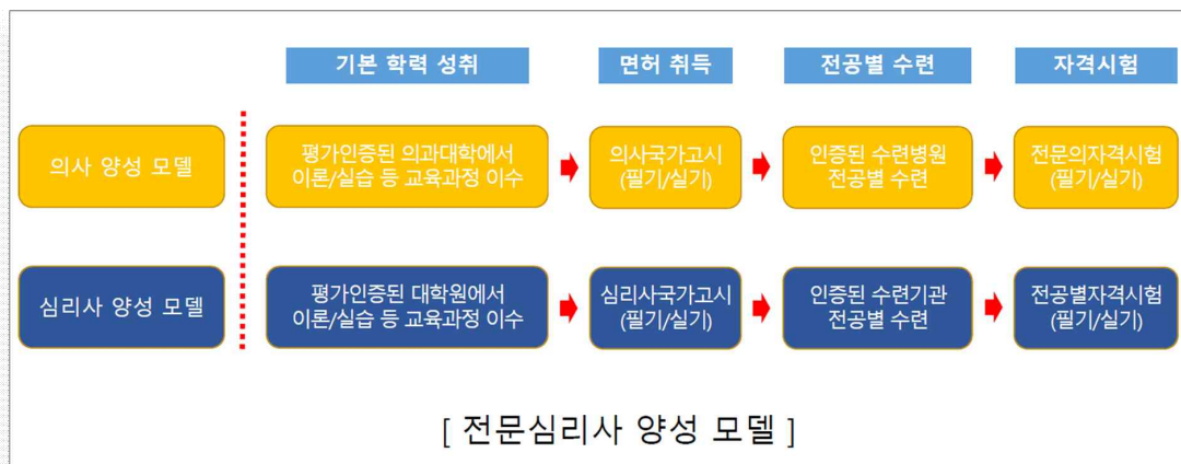
Figure 1. Training model of a professional psychologist